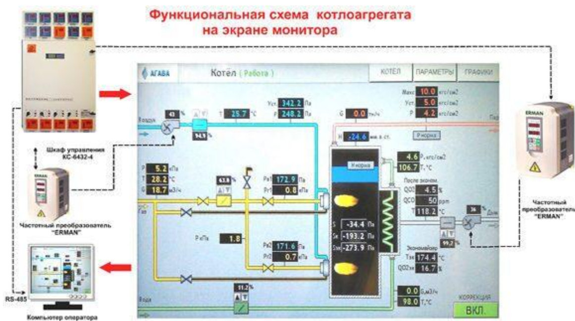
Рисунок 1 - Функциональная схема котлоагрегата на экране монитора