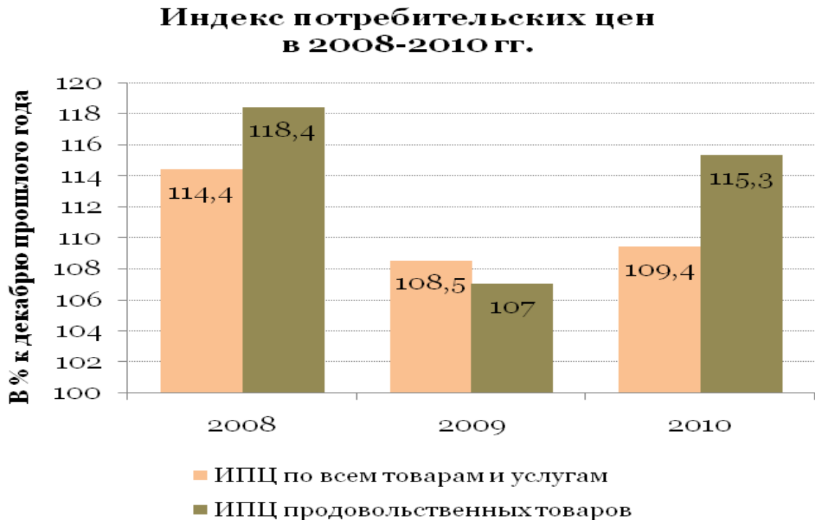
Рисунок 1. Динамика индекса потребительских цен

Цифровой материал рекомендуется помещать в тексте в виде таблиц . Каждая из них должна иметь заголовок, точно отражающий её содержание и расположенный по центру. Помещается заголовок непосредственно над таблицей после слова Таблица, расположенного справа от таблицы (с указанием номера таблицы, без точки).