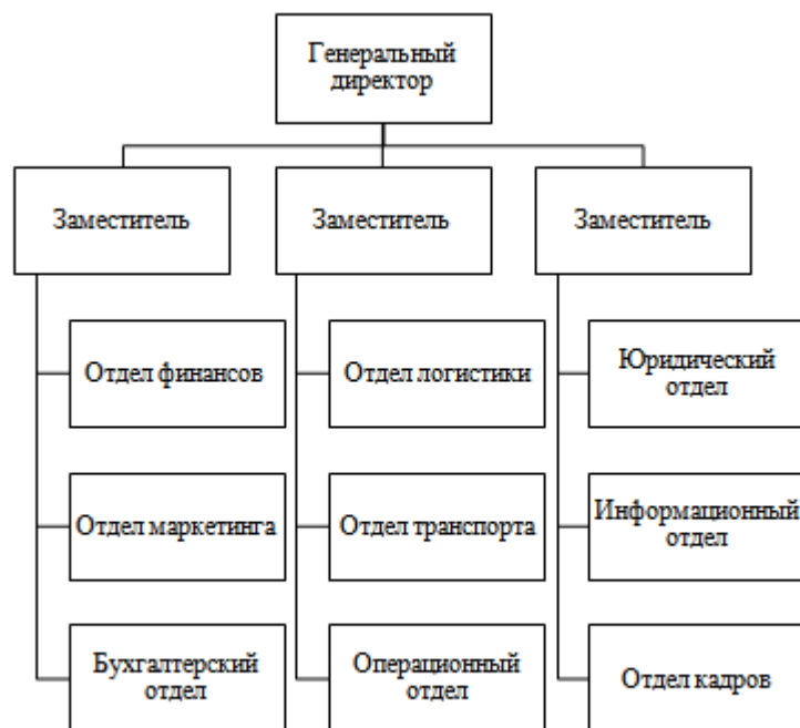
Рисунок 1. Организационная структура ООО «ЗВЕЗДОЧКА»

01 июня 2012 года решением годового Общего собрания акционеров ООО «ЗВЕЗДОЧКА» в состав Совета директоров Общества избраны: