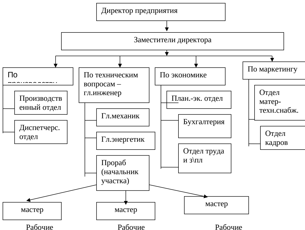
Рис. 1 Организационная структура ООО «Звездочка» ссылка на первоисточник

Так, на рис. 1 представлена организационная структура ООО «Звездочка» где у директора в подчинении находятся его заместители по различным вопросам.