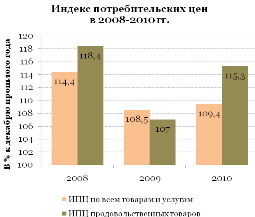
Рисунок 1. Динамика индекса потребительских цен

Название рисунка помещается под ними, пишется без кавычек и содержит слово Рисунок без кавычек и указание на порядковый номер рисунка. Рисунки нумеруются арабскими цифрами сквозной нумерацией в пределах всей работы и располагаются посередине строки.