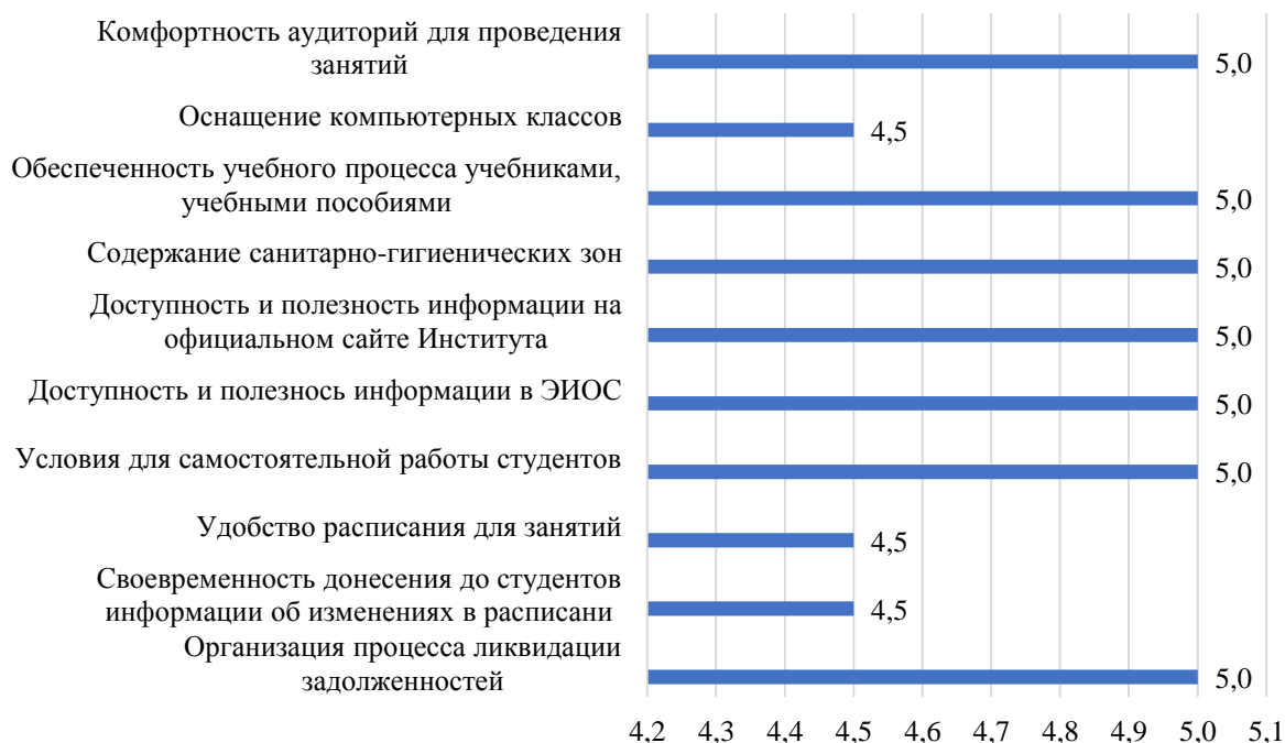
Рисунок 3.30 – Оценка студентами условий, созданных для обучения, балл

В анкетировании участвовали 100% обучающихся по данной образовательной программе. Результаты оценки условий, созданных для обучения, представлены на рисунке 3.30.