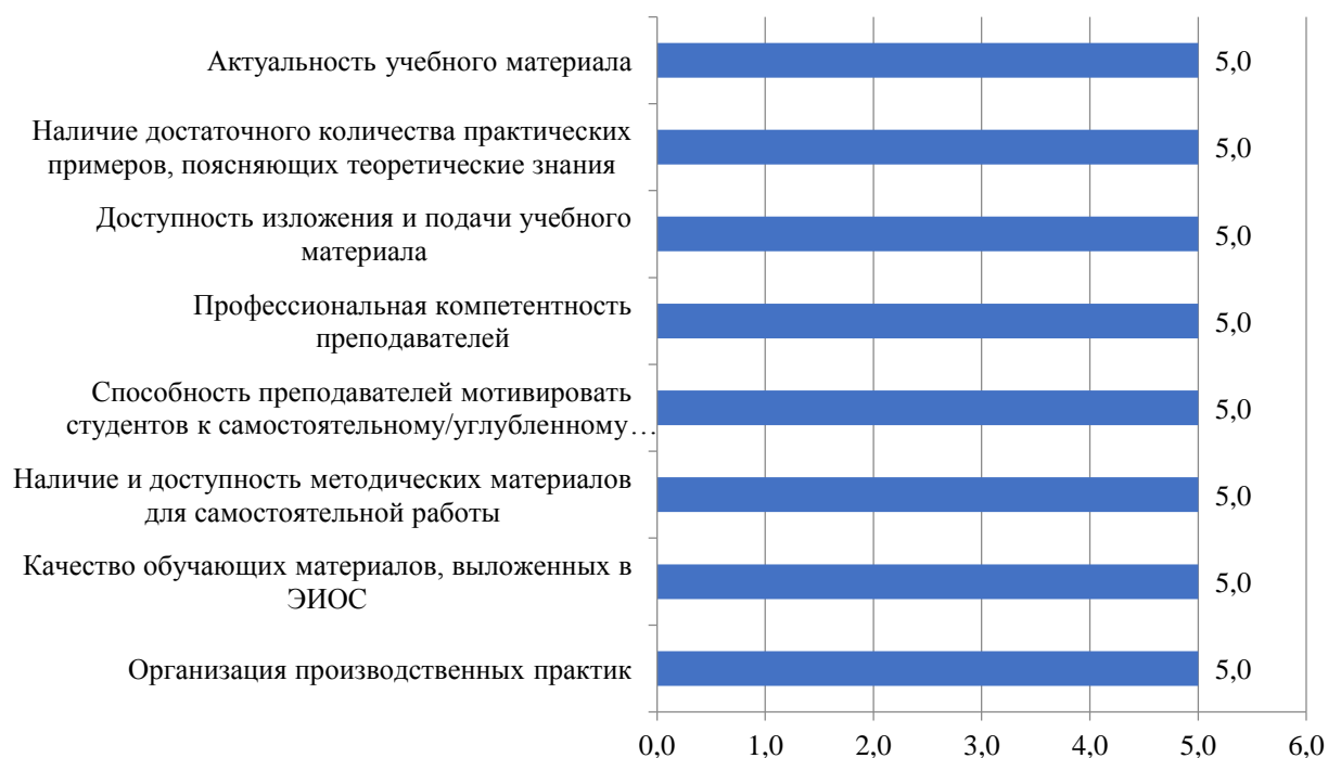
Рисунок 3.32 – Оценка студентами процесса обучения в Институте, балл

Результаты оценки процесса обучения в Институте представлены на рис. 3.32.