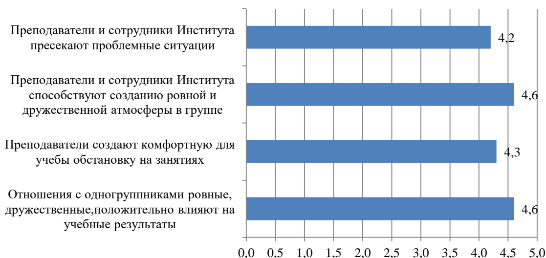
Рисунок А.68 – Оценка обучающимися коммуникаций в учебном процессе, балл

Оценка обучающимися коммуникаций в учебном процессе представлена на рис. А.68.