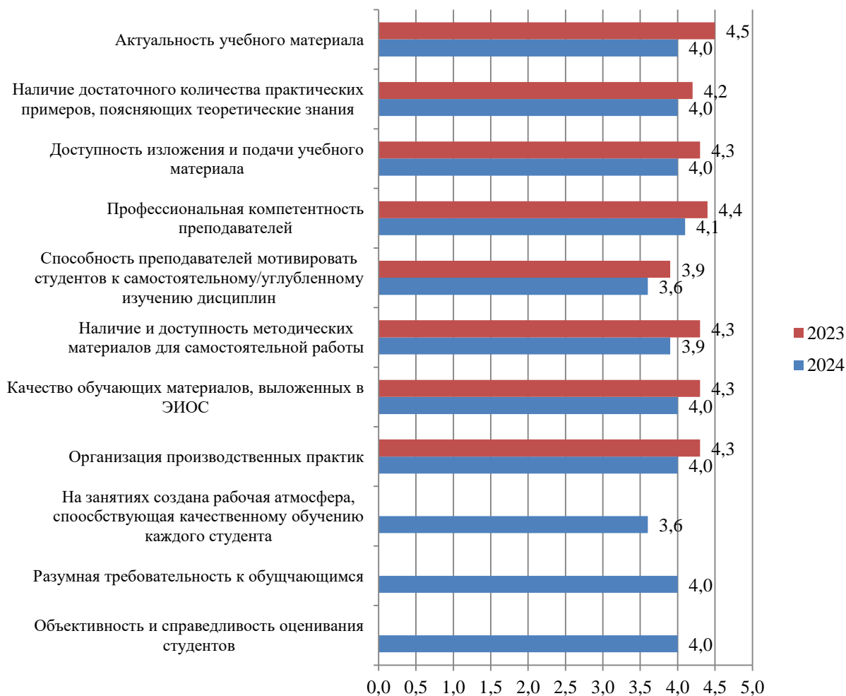
Рисунок А.69 – Оценка студентами процесса обучения в Институте, балл

Результаты оценки процесса обучения в Институте представлены на рис. А.69.