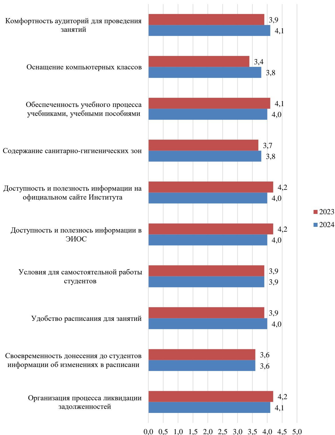
Рисунок А.66 – Оценка студентами условий, созданных для обучения, балл

Результаты оценки условий, созданных для обучения, представлены на рис. А.66.