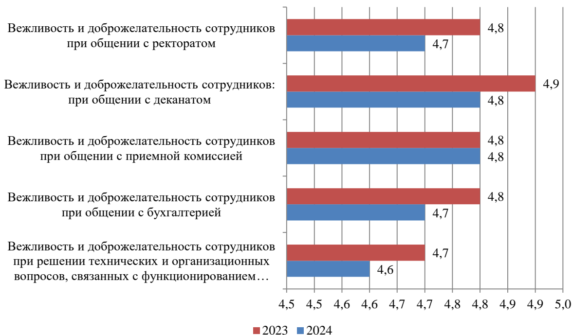
Рисунок Б.2 – Оценка студентами вежливости и доброжелательности сотрудников Института, балл

Результаты оценки вежливости и доброжелательности сотрудников Института представлены на рис. Б.2.