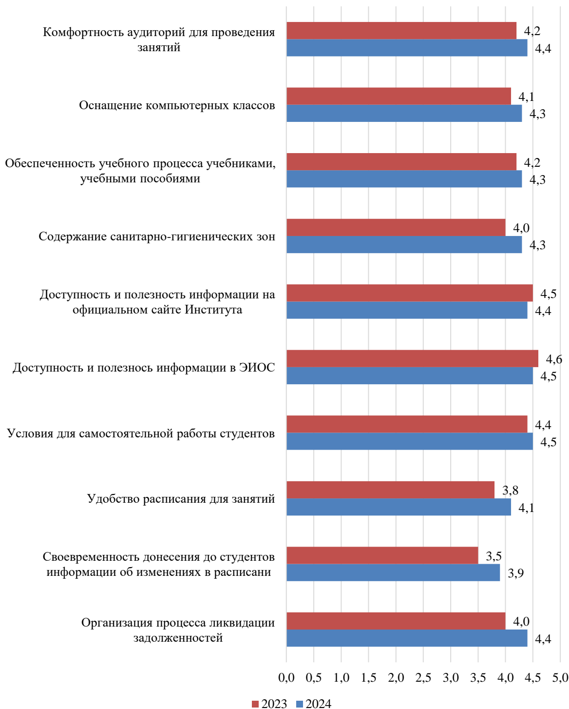
Рисунок Б.1 – Оценка студентами условий, созданных для обучения, балл

Результаты оценки условий, созданных для обучения, представлены на рисунке Б.1.