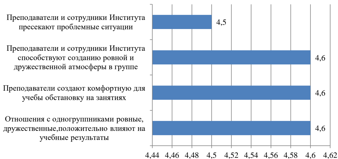
Рисунок Б.3 – Оценка обучающимися коммуникаций в учебном процессе, балл

Оценка обучающимися коммуникаций в учебном процессе представлена на рис. Б.3.