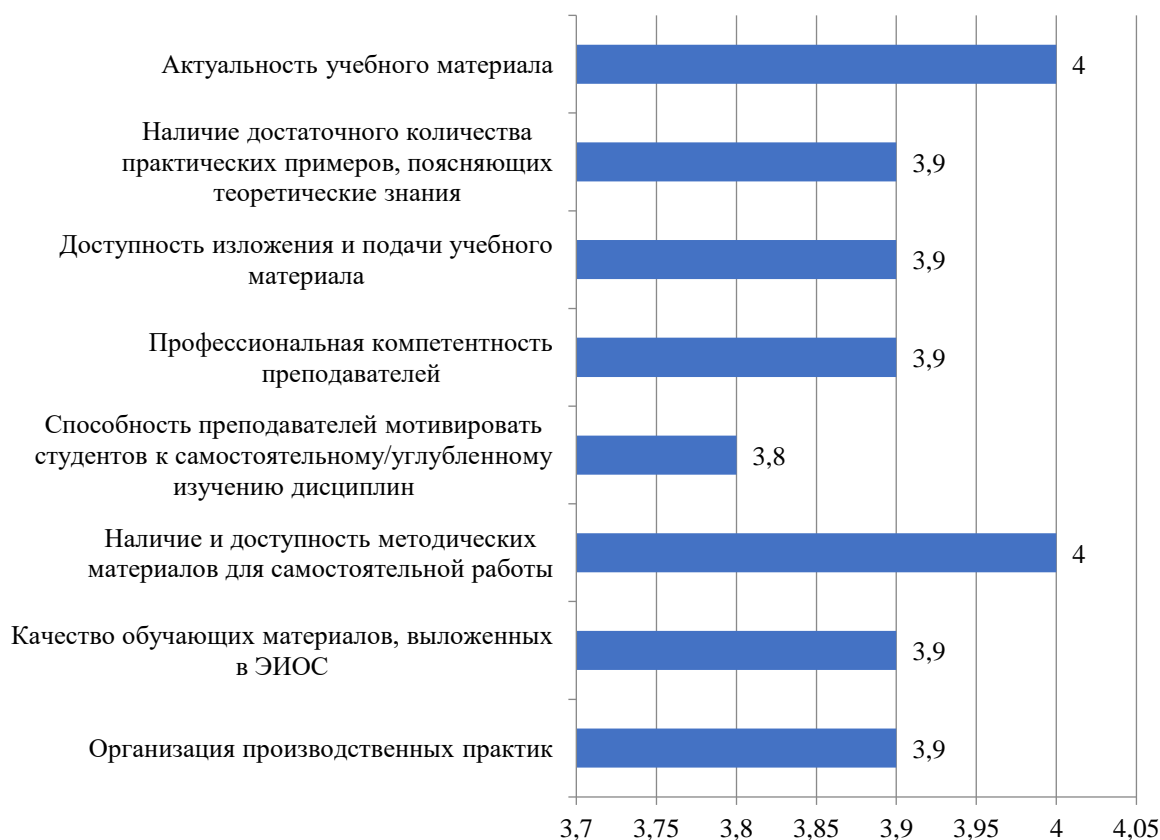
Рисунок 3.22 – Оценка студентами процесса обучения в Институте, балл

Результаты оценки процесса обучения в Институте представлены на рис. 3.22.