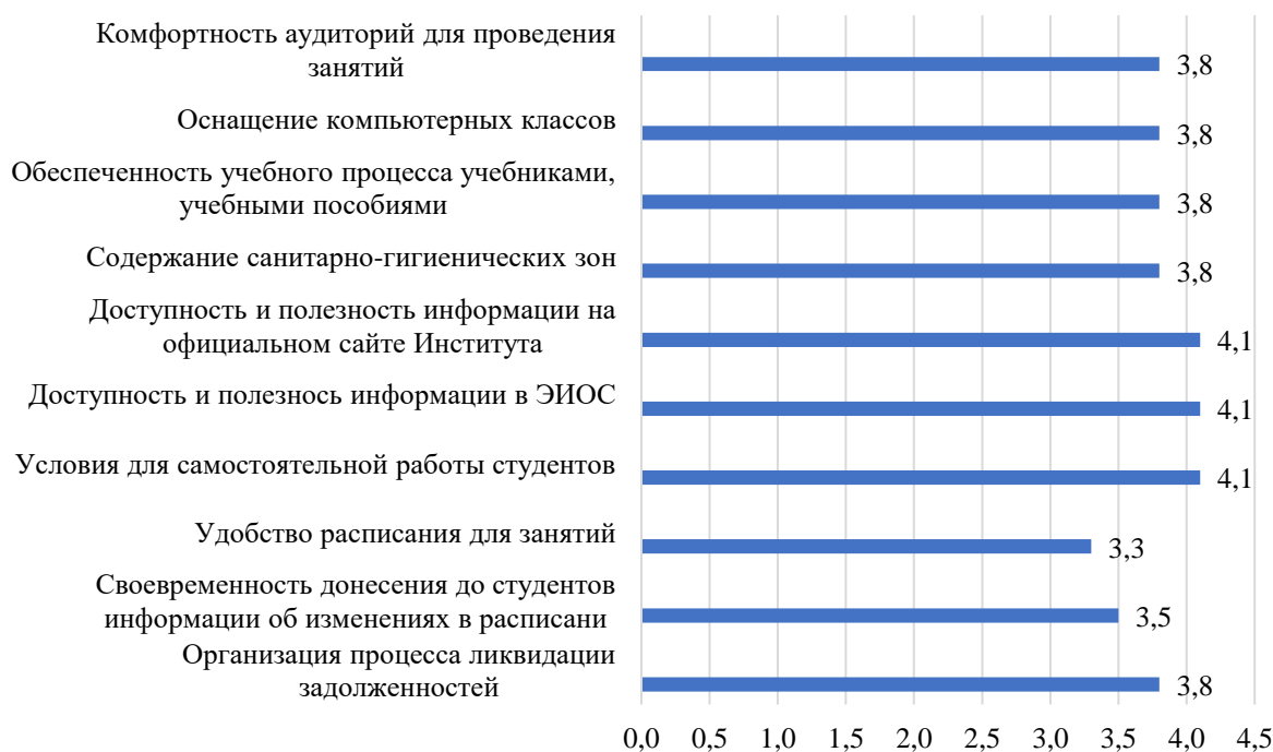
Рисунок 3.19 – Оценка студентами условий, созданных для обучения, балл

В анкетировании участвовали 72% обучающихся по данной образовательной программе. Результаты оценки условий, созданных для обучения, представлены на рисунке 3.19.