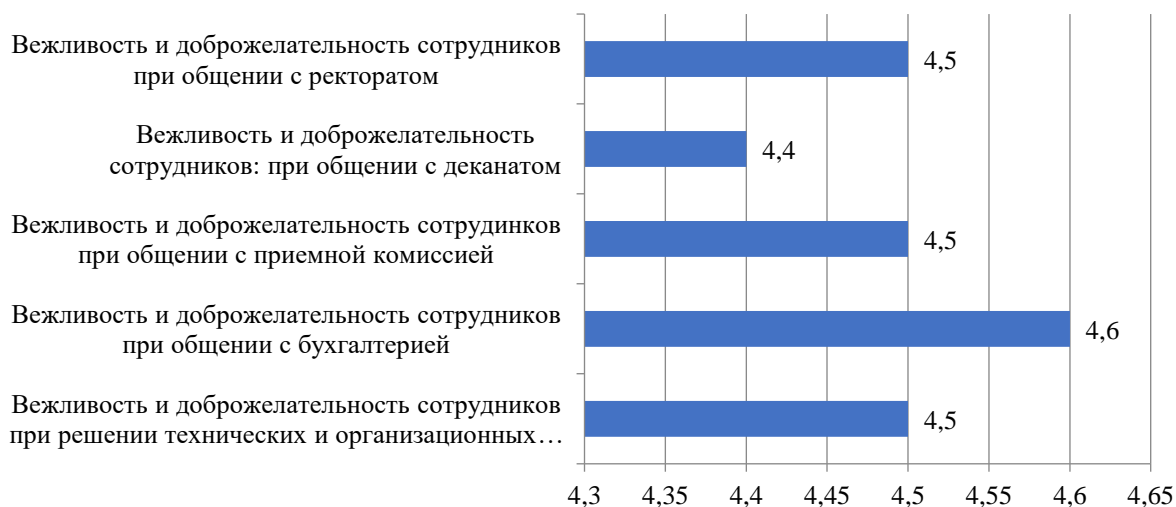
Рисунок 3.20 – Оценка студентами вежливости и доброжелательности сотрудников Института, балл

Результаты оценки вежливости и доброжелательности сотрудников Института представлены на рис. 3.20.