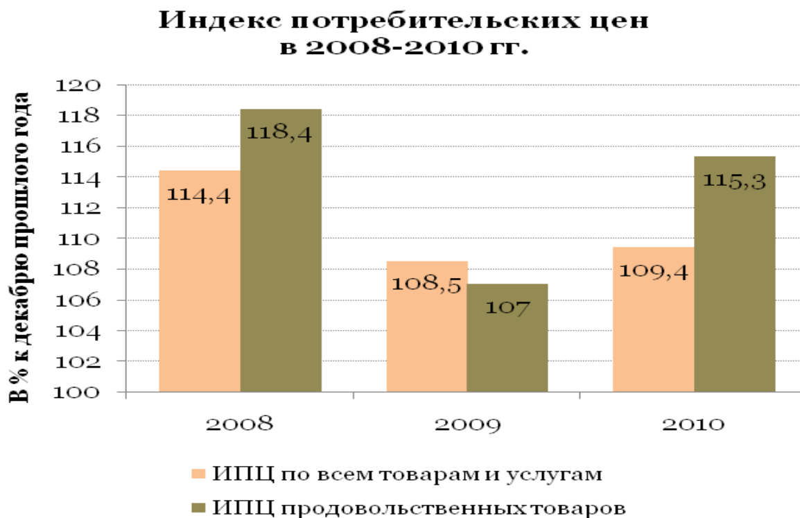
Рисунок 1. Динамика индекса потребительских цен

Цифровой материал рекомендуется помещать в тексте в виде таблиц . Каждая из них должна иметь заголовок, точно отражающий её содержание и расположенный по центру. Помещается заголовок непосредственно над таблицей после слова Таблица, расположенного справа от таблицы (с указанием номера таблицы, без точки).