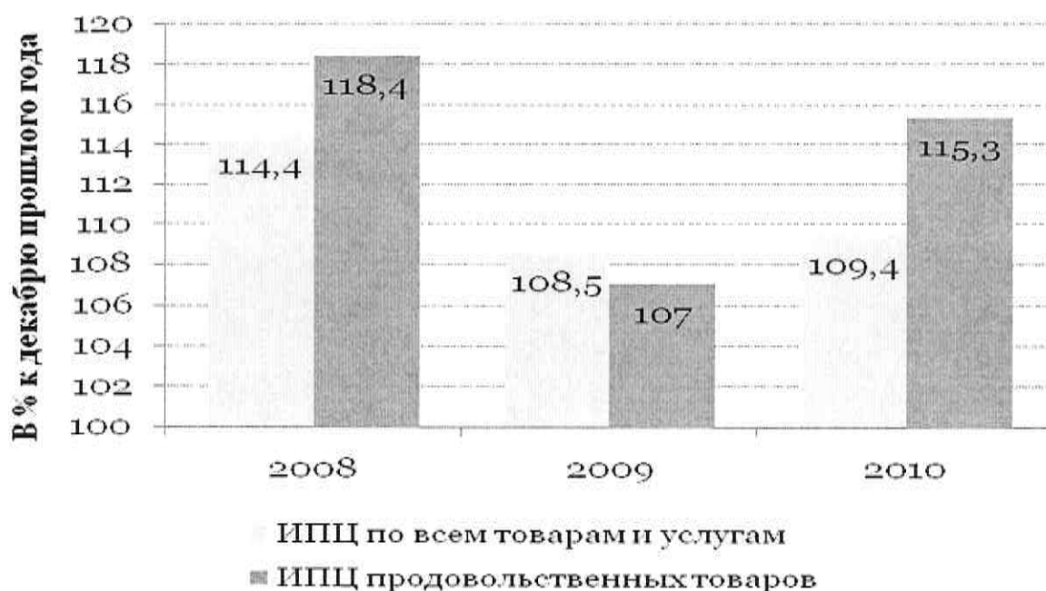
Рисунок 1. Динамика индекса потребительских цен

Цифровой материал рекомендуется помещать в тексте в виде таблиц . Каждая из них должна иметь заголовок, точно отражающий её содержание и расположенный по центру. Помещается заголовок непосредственно над таблицей после слова Таблица, расположенного справа от таблицы (с указанием номера таблицы, без точки).