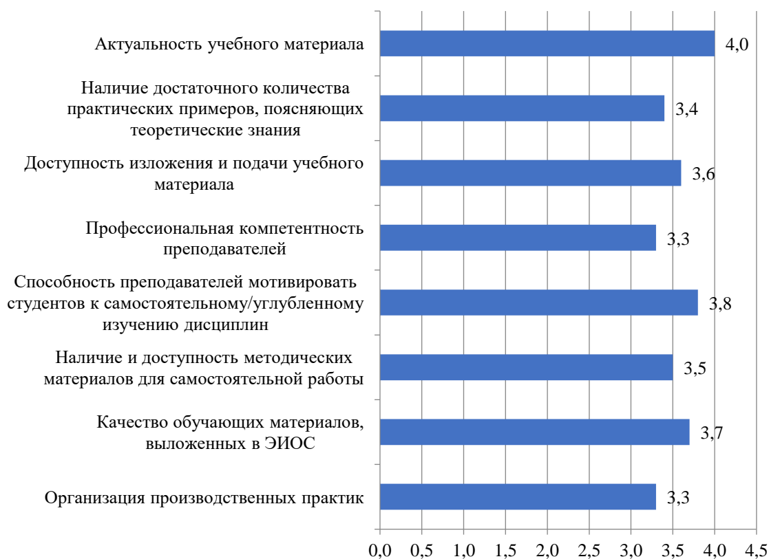
Рисунок 2.28 – Оценка студентами процесса обучения в Институте, балл

Результаты оценки процесса обучения в Институте представлены на рис. 2.28.