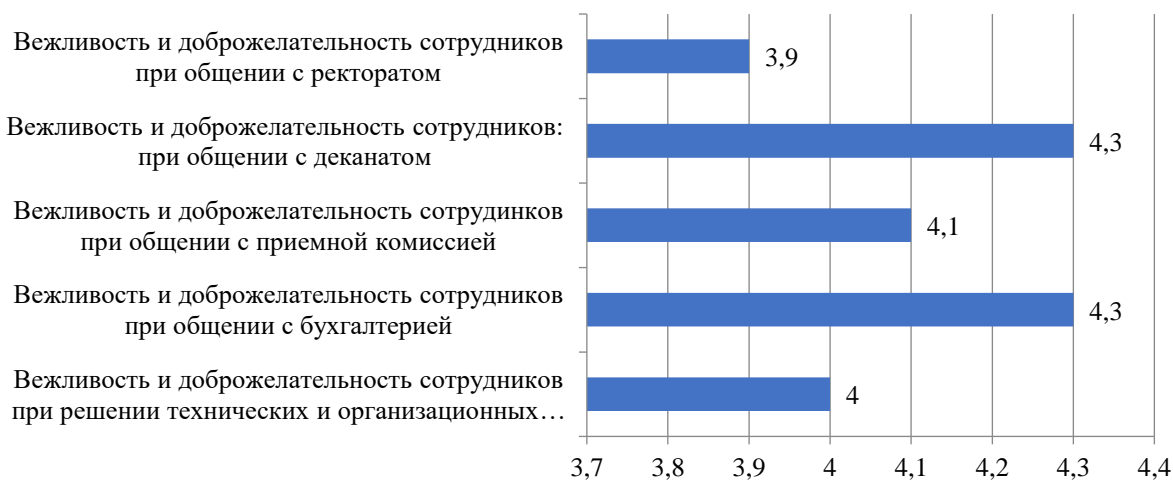
Рисунок 2.26 – Оценка студентами вежливости и доброжелательности сотрудников Института, балл

Результаты оценки вежливости и доброжелательности сотрудников Института представлены на рис. 2.26.