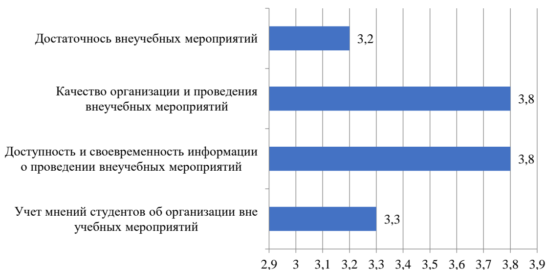
Рисунок 2.29 – Ответ студентов на вопрос «Оцените организацию студенческой жизни», балл

Запрос студентов на организацию более активной и насыщенной студенческой жизни отражен в ответах студентов, представленных на рис. 2.29.