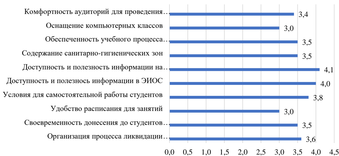
Рисунок 2.25 – Оценка студентами условий, созданных для обучения, балл

В анкетировании участвовали 68% обучающихся по данной образовательной программе. Результаты оценки условий, созданных для обучения, представлены на рисунке 2.25.