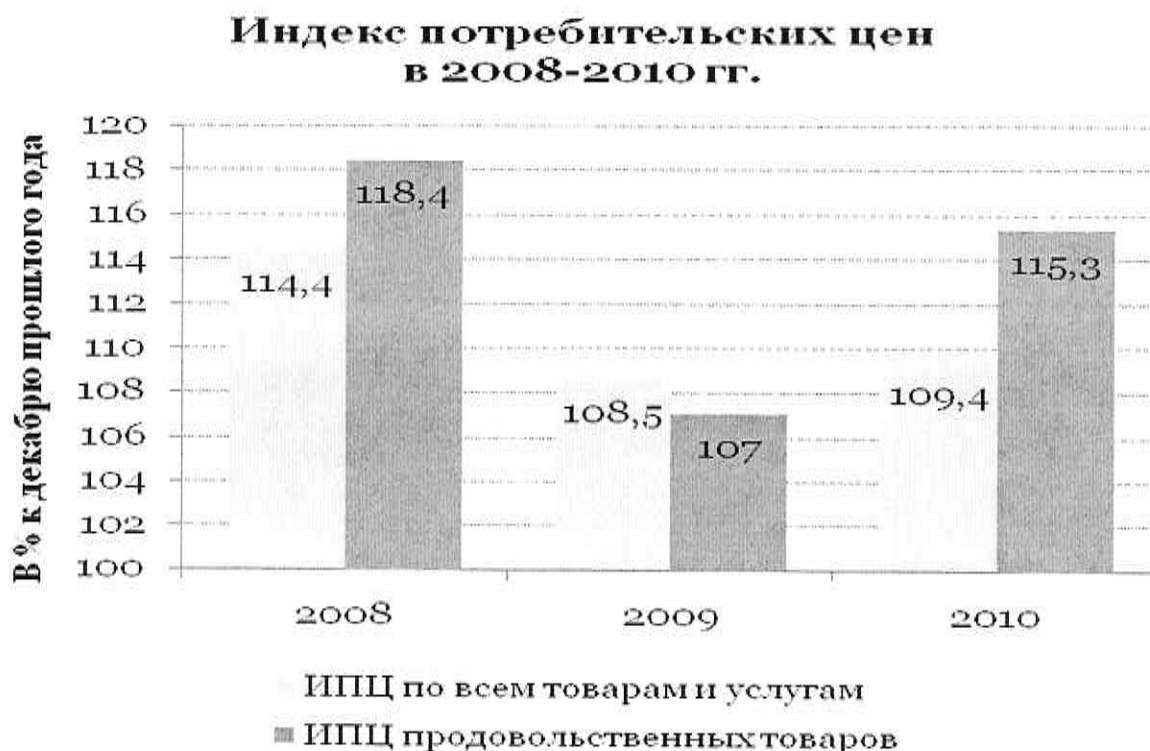
Рисунок 1. Динамика индекса потребительских цен

Цифровой материал рекомендуется помещать в тексте в виде таблиц . Каждая из них должна иметь заголовок, точно отражающий её содержание и расположенный по центру. Помещается заголовок непосредственно над таблицей после слова Таблица, расположенного справа от таблицы (с указанием номера таблицы, без точки).